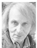
„Auch ich bin Charlie“, sagte der 56-jährige Michel Houellebecq nach dem Anschlag auf Charlie Hebdo. Obwohl er seine Werbeauftritte abgesagt hat, wird er am kommenden Montag in Köln aus dem Roman lesen.

Es ist ein gespenstisches Déjà-vu: Wer Michel Houellebecqs neuen Roman „Unterwerfung“ liest, kommt irgendwann zu der Szene, in der Houellebecqs Ich-Erzähler François an einer verwüsteten Tankstelle Halt macht, vor der eine Leiche liegt. Unmöglich, dabei nicht an die Brüder Kouachi zu denken, die auf ihrer Flucht aus Paris eine Tankstelle überfallen haben. Auf der Flucht ist auch François im Buch, und zwar, den Seitenhieb auf den Islam lässt