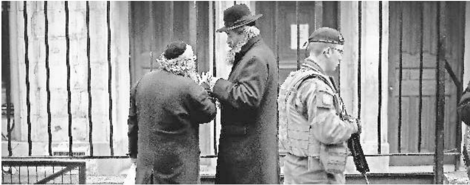
Frankreichs Juden, einst Kern der Zivilgesellschaft, fühlen sich im Stich gelassen: Nach den Anschlägen patrouilliert ein Soldat vor einer jüdischen Schule in Paris.

Am vergangenen Wochenende erlebte Frankreich zweierlei: die wohl größten Demonstrationen der Neuzeit und die Bestätigung, dass ein Riss durch die Gesellschaft geht. Die muslimische Bevölkerung blieb den Willenskundgebungen gegen den Terror meistens fern. Das heißt nicht, dass sich keine Muslime unter den Demonstranten befanden. Die islamischen Würdenträger hatten zur Teilnahme aufgerufen. Und zahllose Personen aus muslimischen Familien waren von Anfang an bei den Trauerkundgebungen aktiv. Aber die meisten davon waren Muslime von der Art, wie ich Jude bin, in die Jahre gekommene Atheisten mit Linksdrall. Ich wohne in Paris, aber mein Viertel im volkstümlichen Nordosten der Stadt hat so ziemlich alles zu bieten, darunter etliche „Cités“, ein Begriff, der sowohl die Sozialwohnbauten als auch ihre überwiegend franko-arabischen und franko-afrikanischen Mieter umfasst.